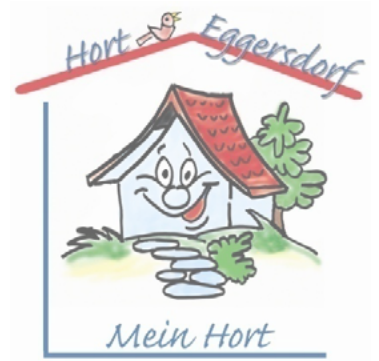
Bild vom Kind

Jedes Kind ist eine freie eigenständige und vollwertige Persönlichkeit mit unterschiedlichen Wünschen, Vorstellungen und Charaktereigenschaften, die Anerkennung und Bestätigung erhält. Kinder bekommen die Möglichkeit, eigene immer neue Erfahrungen zu sammeln, um die Welt besser kennen zu lernen. Unsere Kinder brauchen emotionale Sicherheit. Erfolgserlebnisse sind für sie wichtig, um ihr Selbstwertgefühl zu stärken.